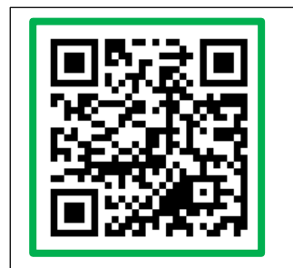
(国) 150 号 八楠交差点