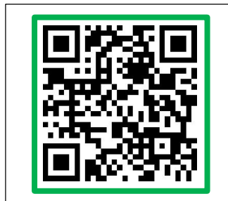
(国) 150 号 石脇下