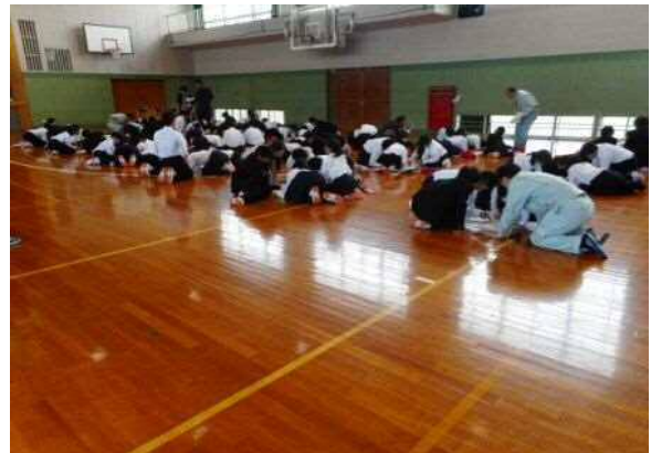
手作りハザードマップ作成