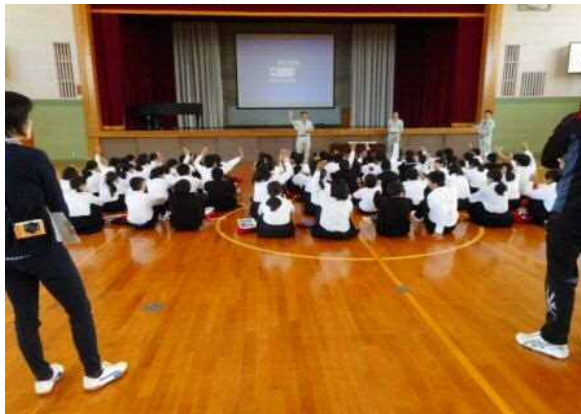
土砂災害及び水害の説明