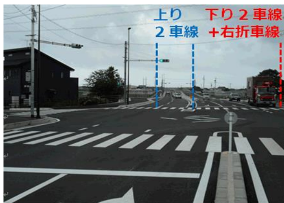
開通した三和南交差点の様子