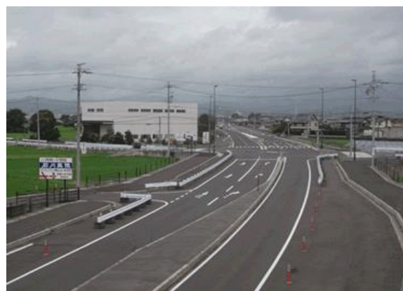
残りの区間も4車線化に向けて現在整備中！